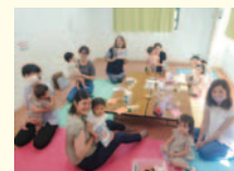
検診をテーマにしたお茶会の様子

日々頑張っているママたちへ、「自分の体も大切にしようね」というメッセージとともに今の身体の現状がわかる検診を実施しています。30代から罹患リスクが上昇する乳がんと子宮頸がんからママたちを守りたいです。初回無料ですので、まだ参加したことがない方は是非参加してみてください。