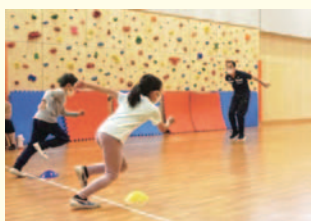
いろいろチャレンジ「よこはまこどもカレッジ」

50号おめでとうございます!弊社がWebサイト「あそびい横浜」を始める数年前に刊行されていて、子育て世代向けメディアの大先輩だと思っています。紙面の企画力は常に読者目線で興味深く、いつも参考にさせて頂いています。これからも100号、200号を目指して頑張ってください!