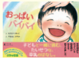
作：わたなべけいこ 絵：やまはしざやか 出版：株式会社幻冬舎

横浜市で看護師・助産師資格を取得し、1996年出張開業助産師として届出。児童精神科医の故・佐々木正美医師のゼミから学んだ「子どもへのまなざし」を地域のママたちに伝えながら活動中。2017年12月に絵本「おっはいバイバイ」を自費出版。