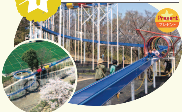
2024年3月にリニューアル。5m長くなりました！ 圧巻のすべり台の全景。