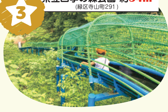
木々に囲まれて森の中をすべっているよう！