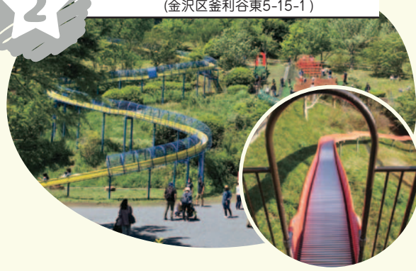
四季折々の草花を楽しみながらすべろう。 小さいすべり台も約30mの長さ！