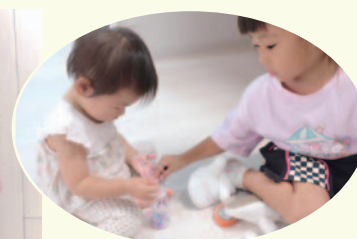
ボトルに材料を入れるだけ