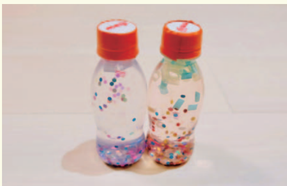
カラカララトルがスノードームに変身