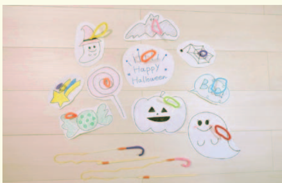
ハロウィン釣りにチャレンジ