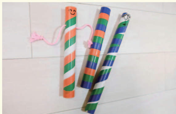
カラフルでかわいいくるくる棒ができました