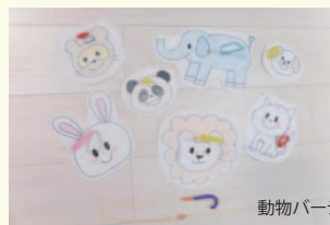
動物バージョンも作ってみました!