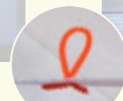
画用紙につけるモールはこんな感じに