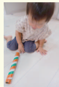
1歳3か月のことはちゃんは転がすだけでも興味津々