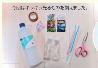
今回はキラキラ光るものを揃えました。

ビーズやホログラムなど、好きな物を入れてフタをするだけで簡単に赤ちゃんの好きな音が鳴る「カラカララトル」を作ることができます。中に入れる物は鈴やお米、なんでも大丈夫! 今回は100円ショップで購入できるビーズ、キラキラホログラム、ストローを好きな長さにカットして入れました。0歳1歳の時はカラカララトルとして遊び、そのあとは洗濯のりを入れるだけでスノードームに変身! 蓋が開かないようにしっかりテープで止めてくださいね。