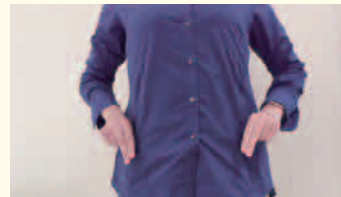
腰のあたり(オムツテープのあたり)で親指・人差し指・中指の三本をつけたりはなしたりします。