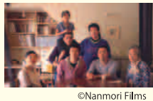
ドキュメンタリー映画「愛と法」 大阪の下町で法律事務所を営む弁護士夫婦(ふうふ)の生活と日常を通して社会的マイノリティと言われる人々に焦点をあてた映画。

「今後の活動の予定は？」 近頃はダイバーシティへの社内の理解浸透に取り組み企業も増えており、この活動に賛同する動きも。そのような企業や団体、個人と連携しながら、多くの人がこの映画を届けたいと思っています。